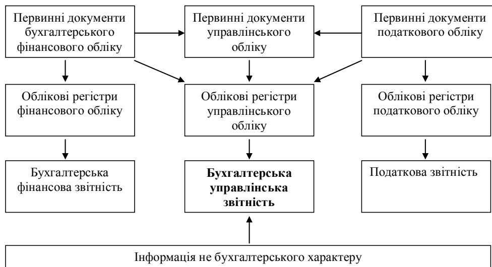
Рис. 1. Інтегрована інформаційна база, яка використовується під час формування інформації бухгалтерської управлінської звітності [5, с. 19]

обсягу діяльності потребує різних виражених підходів до питання формування управлінської звітності. Якщо підприємство мале, де керівник і власник – одна особа, управлінська звітність є взагалі зайвою, оскільки він сам себе забезпечує інформацією. Чим більше підприємство, чим більше рівнів управління і керівництво далі від місць виробництва, тим гостріше постає питання необхідності управлінської звітності. Внутрішня звітність підприємства має бути різною за об’ємом і деталізацією для різних рівнів управління: чим нижче менеджер знаходиться по ієрархії, тим об’ємнішою та деталізованішою має бути для нього інформація. Враховуючи ці обставини та відсутність досвіду в облікових працівників нашої країни, на часі є необхідність в узагальненні напрацювань із даного питання та оформленні методичних рекомендацій за галузями діяльності підприємств щодо організації управлінського обліку та формування управлінської звітності підприємств.