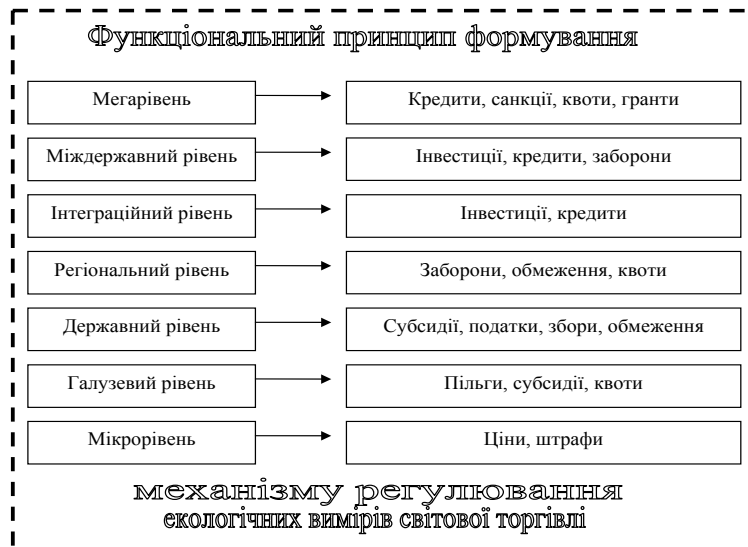
Рис. 2. Функціональний принцип формування механізму регулювання екологічних вимірів світової торгівлі