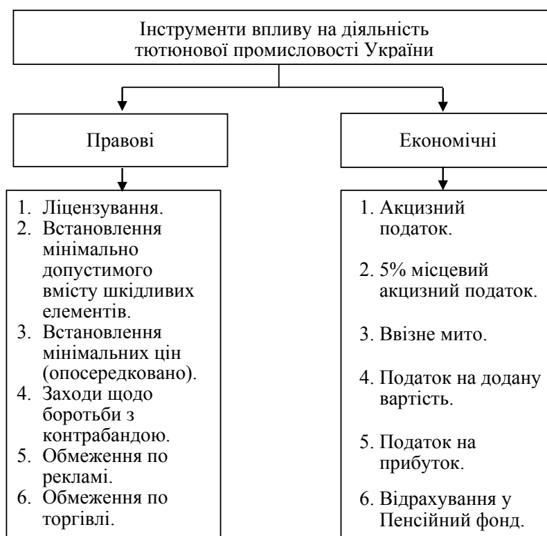
Рис. 1. Інструменти впливу на діяльність тютюнової промисловості України станом на 01 січня 2017 року

Регулювання якості продукції тютюнової промисловості, заборона чи дозвіл реклами щодо її споживання та збереження здорового способу життя громадян України не вимагають економічної оцінки. Цими заходами забезпечується обмеження попиту на продукцію, що є шкідливою для здоров'я громадян, але, незважаючи на шкідливість споживання, купується населенням.