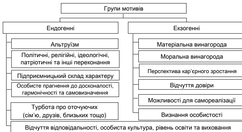
Рис. 3. Типологія мотиваційних чинників мотивації особистості, залученої до виробничого процесу

вищу посаду, яке супроводжується збільшенням заробітної плати, є позитивною мотивацією, оскільки означає, що топ-менеджмент визнає не аби яку цінність особи для організації.