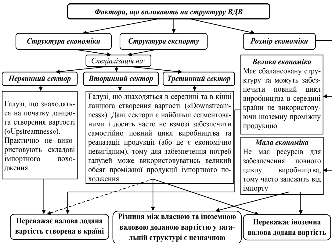
Рис. 1. Фактори впливу на структуру валової доданої вартості країни

З рис. 1 видно, що власна додана вартість переважає в економіці великих країн та/або в країнах, де найбільшу частку в структурі економіки займає первинний сектор. Однак існують і певні виключення. Так, такі великі економіки як США, Китай, Німеччина та Японія в більшості спеціалізуються на продукції вторинного та третинного секторів, однак в їх структурі переважає частка вітчизняної доданої вартості (на рис. 1 ця ситуація зображена пунктирною лінією), що пояснюється тим, що для цих країн з однієї сторони досить важливою є економічна безпека і вони обмежують імпорт продукції з метою захисту національного виробника. З іншої сторони, з точки зору участі у ГЛСВ вони є в більшості постачальниками проміжної продукції різного ступеня складності в інші країни, які є реципієнтами.