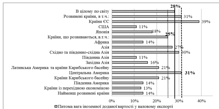
— Середнє значення питомої ваги іноземної доданої вартості у валовому експорті в світі (28%) ..... Середнє значення питомої ваги іноземної доданої вартості у валовому експорті в країнах, що розвиваються (25%) - - - Середнє значення питомої ваги іноземної доданої вартості у валовому експорті в країнах, що розвиваються (31%)

Таким чином, сукупний експорт більшості великих розвинених країн, а також країн-експортерів природних ресурсів складається в більшості із власної доданої вартості: США (89%), Бразилія (87,3%), Японія (87,8%), Австралія (88,6%), Росія (98,8%) тощо. Іншою є картина в країнах,