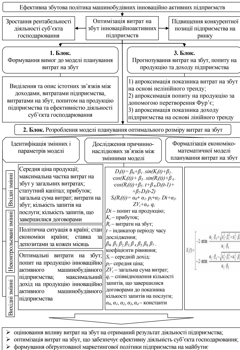
Рис. 4. Науково-методичний підхід до планування оптимального значення витрат на збут інноваційно активних машинобудівних підприємств