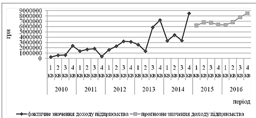
Рис. 3. Динаміка фактичних і прогнозних значень доходу ТОВ «Турбомаш» за період із 2015 по 2016 р. у розрізі кварталів, грн.