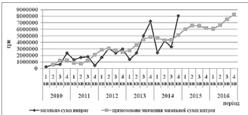
Рис. 1. Динаміка фактичних і прогнозних значень загальних витрат ТОВ «Турбомаш» за період із 2010 по 2016 р. у розрізі кварталів, грн.