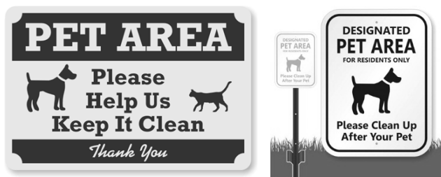
Рис. 2. Приклади агітаційно-інформаційних стендів необхідності прибирання за тваринами

підвали, закинуті будівлі) сприяють стрімкому збільшенню чисельності популяції безпритульних тварин (в особливості котів та собак), таким чином одним з необхідних заходів контролю чисельності тварин без господарів є обмеження цих сприятливих умов.