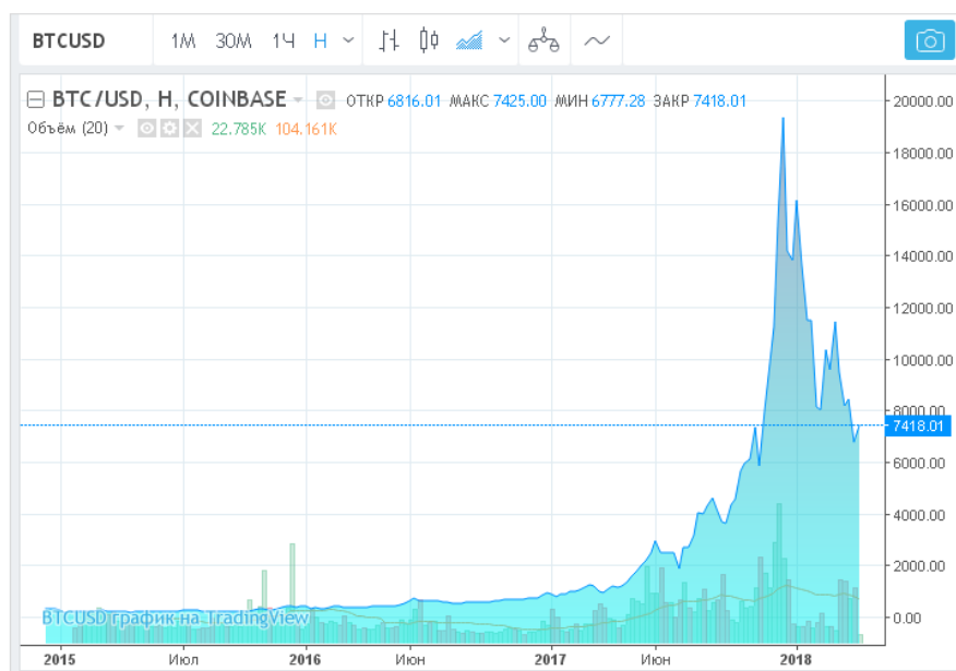
Рис. 1. Динаміка курсу «біткоїн» за 2015-2018 рр. [2]

безготівкові кошти. Відмінність українського законодавства від європейського полягає в тому, що останнє не обмежує коло емітентів лише національними банками, а надає таке право й іншими установами, які дотримуються встановлених вимог: