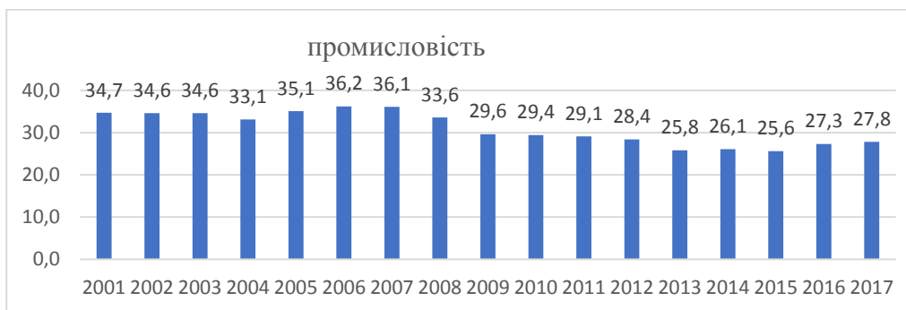
Рис. 2. Динаміка питомої ваги промисловості у структурі ВВП України протягом 2001–2017 рр., %

Такий порівняльний аналіз структурних особливостей ВВП свідчить про існування низки відмінностей. Будівництво в Україні менш розвинене, ніж в країнах ЄС та Великої сімки. Натомість більш розвиненими є торгівля, транспорт, проживання, ремонт та харчова діяльність. Недостатньо розвинутим є сектор інформаційних та комунікаційних послуг. Майже на рівні Європейського Союзу розвивається сектор фінансової та страхової діяльності. Суттєво відстають від розвитку зазначених країн операції з нерухомістю, а також професійної, науково-технічної, адміністративної та допоміжної діяльності. Менш розвиненими є державне управління, оборона, освіта, охорона здоров'я та соціальна робота.