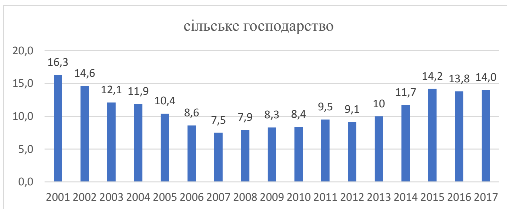
Рис. 1. Динаміка питомої ваги сільського господарства у ВВП економіки України протягом 2001–2017 рр., %

Упродовж 2001–2017 рр. частка сільського господарства у ВВП змінювалась хвилеподібно, а саме з 16,3% у 2001 р. до 7,5% у 2007 році, знову сягнувши максимальних значень у 2015 році, коли складала 14,2% ВВП. Зростання сільського господарства не відповідає тенденціям розвитку структури розвинених країн, в яких частка сільського господарства в структурі ВВП коливається від 0,6% в Німеччині до 2,3%