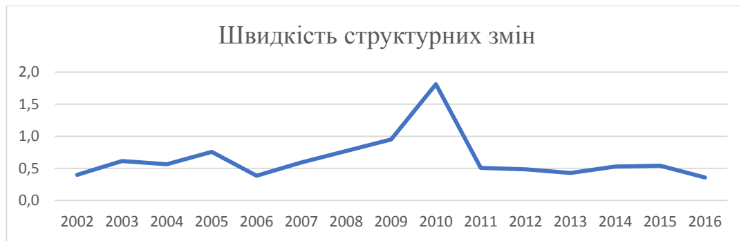
Рис. 4. Швидкість галузевих структурних змін економіки України