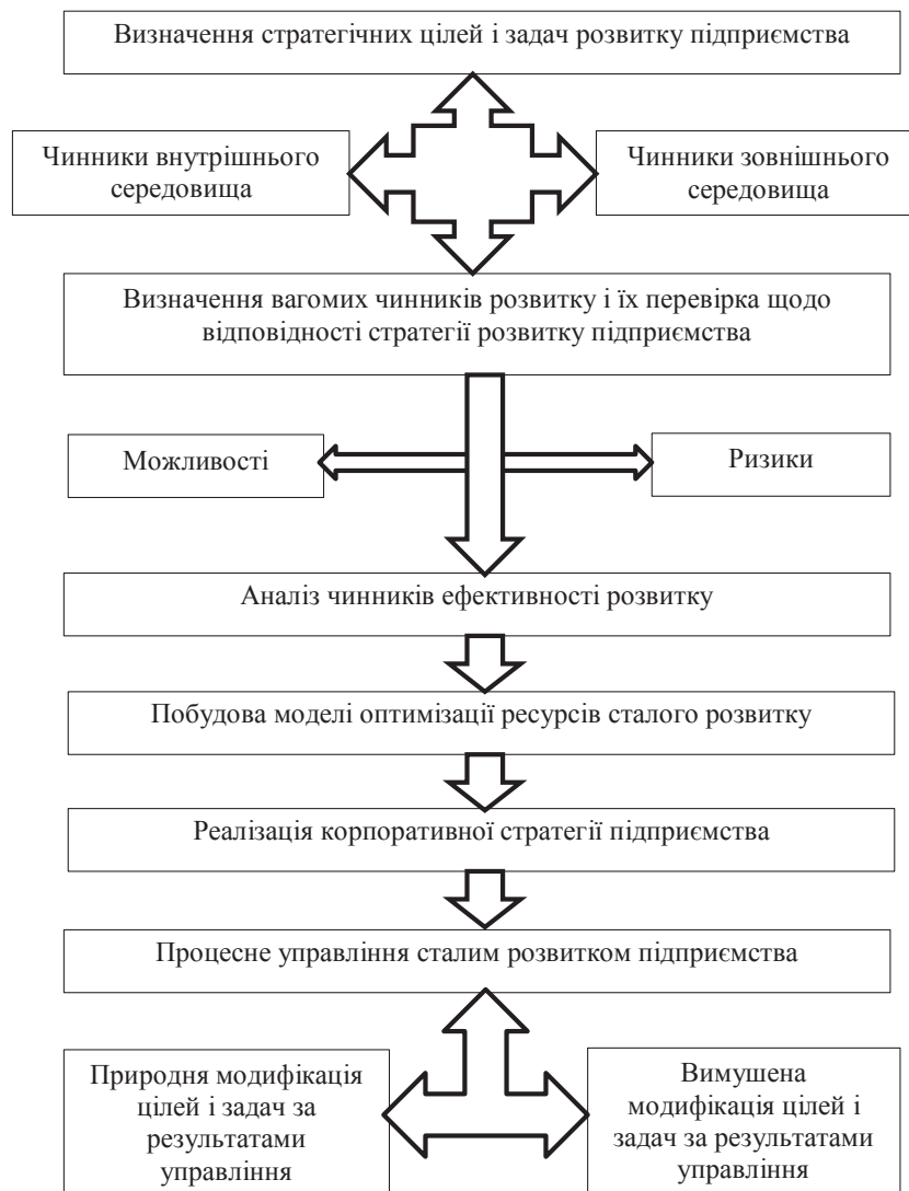
Рис. 2. Модель механізму забезпечення сталого розвитку підприємства торгівлі

Останній блок проблем процесного управління складається з проблем вивчення об'єкта