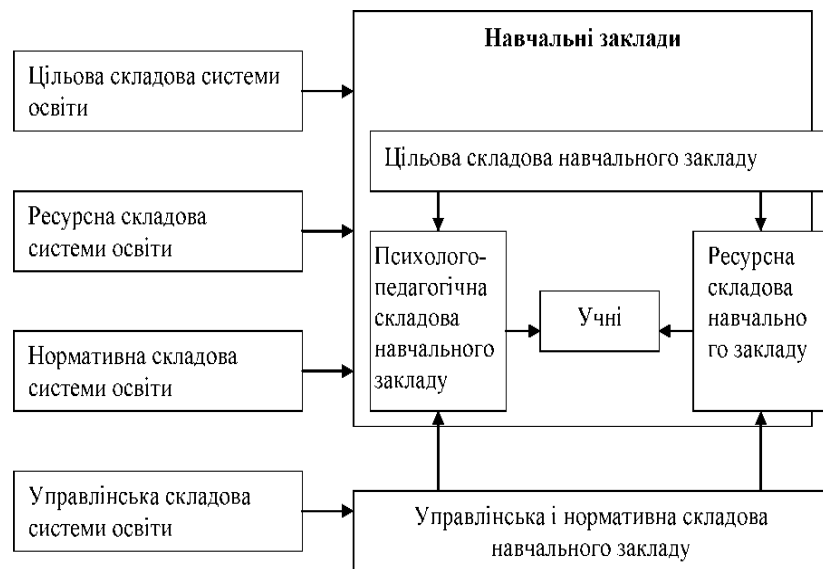
Рис. 1 Модель вибудови освітнього середовища

Фахівці, що займалися проблемою освітнього середовища, зазначають надзвичайно широкий спектр напрямів опрацювання розвитку фахової спрямованості особистості студента в умовах освітньо-виховного середовища педагогічного навчального закладу [9, с. 122]. Нижче наводиться модель (див. Рис. 1), що визначає цілі та завдання функціонування системи освіти наступним чином [4, с. 121]: