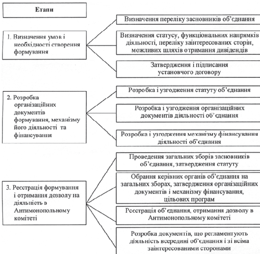
Рис. 3. Механізм організації професійного об'єднання на сучасному етапі

Узагальнений механізм організації таких формувань може бути представлений наступними етапами. На першому етапі визначаються умови, які будуть покладені в ос-