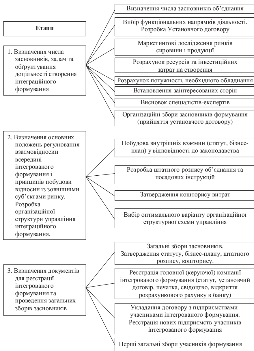
Рис. 1. Механізм організації виробничих інтегрованих формувань

ми органами повинні базуватися на основі діючих законодавчо-нормативних документів, що стосуються регулювання його діяльності.