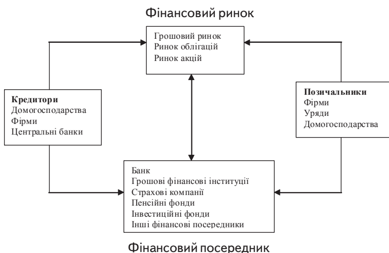
Рис. 1. Огляд функціонування фінансової системи

Фінансова система країни представлена сукупністю економічних відносин та інститутів, що пов'язані з рухом грошового капіталу. Вона