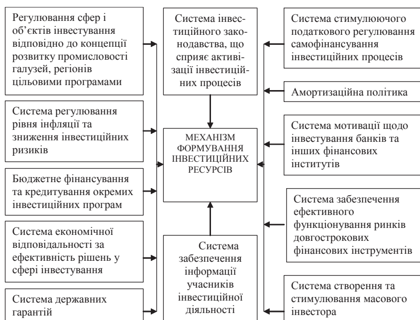
Рис. 2. Структурна схема економічного механізму формування інвестиційних фінансових ресурсів

необхідним є виявлення потенційних можливостей та умов активізації дієвості всіх внутрішніх джерел фінансування інвестиційної діяльності, у тому числі таких потужних, як кошти банківської системи, заощадження населення, амортизаційні нарахування, прибуток, які за умов економічного зростання відіграють основну роль у фінансуванні інвестиційних процесів.