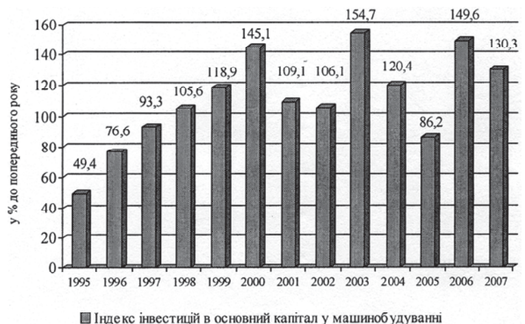
Рис. 1. Динаміка інвестицій в основний капітал машинобудівного комплексу України

Негативні тенденції в інвестиційно-інноваційному напрямі розпочалися після 1991 р., коли різко впала інвестиційна діяльність, призупинився збут обладнання, механізмів для оновлення і розвитку активної частини виробничих фондів. Це призвело до стійкої тенденції скорочення надходжень до бюджету України від підприємств та організацій машинобудування. Окреслені тенденції збереглися до 1995 р. (зниження капітальних вкладень в основний капітал у машинобудуванні України досягло кризового рівня) [1, с. 32], після 1996 р. спостерігається підвищення рівня інвестицій в основний капітал машинобудування та їх нарощування, про що свідчать індекси інвестицій (рис. 1) [9], хоча за деякі роки