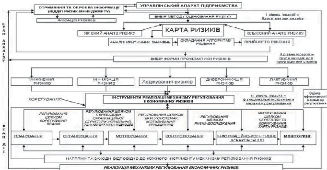
Рис. 1. Механізм регулювання економічних ризиків підприємств

У перехідний період соціально-економічного розвитку України кількість факторів ризику, які послаблюють умови стабільної роботи підприємства, зростають, тому функція регулювання ризиків стає однією з важливих умов забезпечення економічної безпеки підприємства. Для реалізації цієї функції на підприємстві необхідні значні організаційні зусилля, витрати часу та інших ресурсів. Найбільш доцільно здійснювати регулювання економічних ризиків засобами спеціальної системи управління. Отже, розробка саме механізму регулювання економічних ризиків підприємств на сьогодні є надзвичайно актуальним питанням.