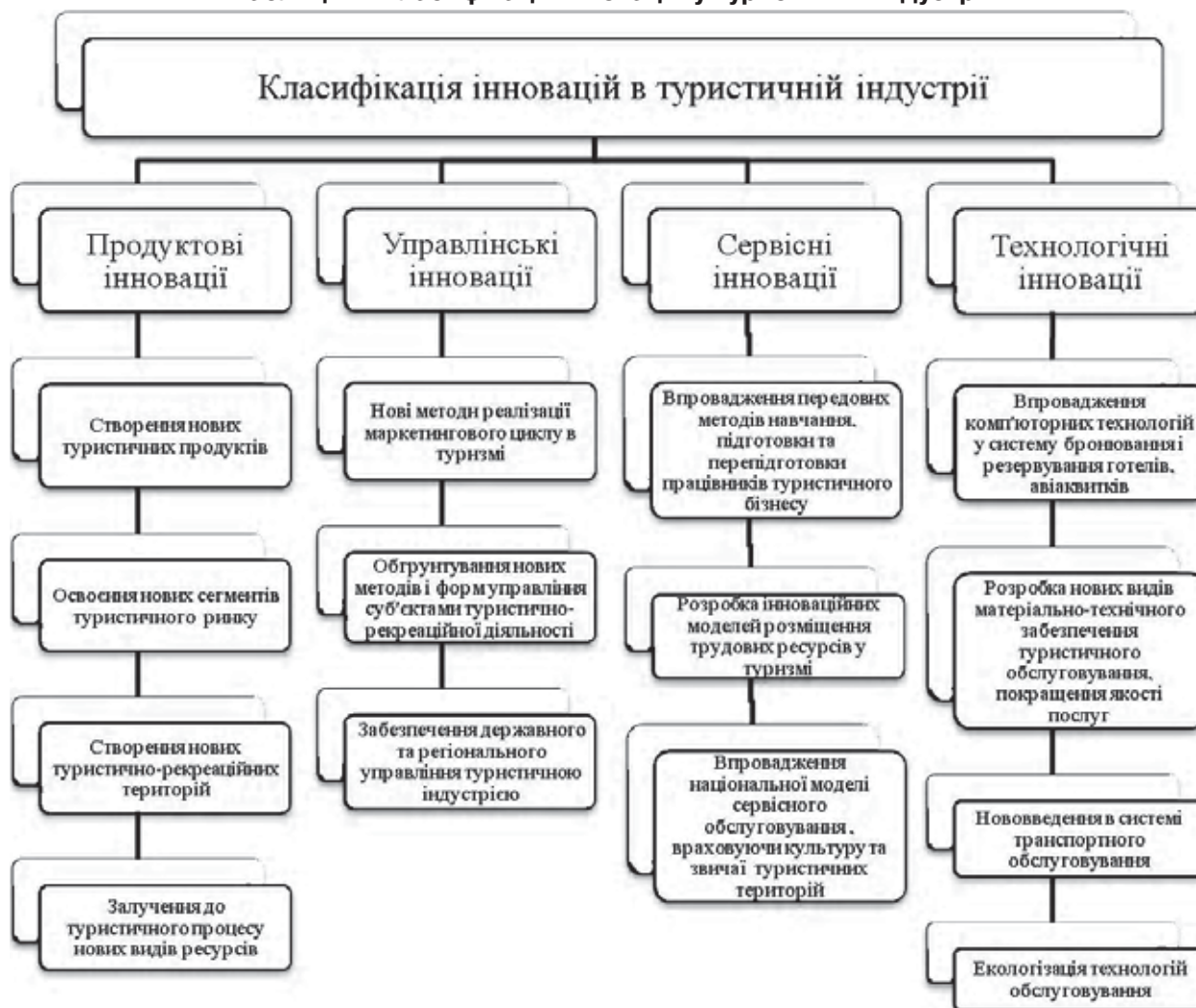
Таблиця 1. Класифікація інновацій у туристичній індустрії

4. Екологізація технологій обслуговування. Вона є обов'язковою в результаті зростання масштабів рекреаційно-природокористування і посилення негативного впливу туризму на стан природних комплексів.