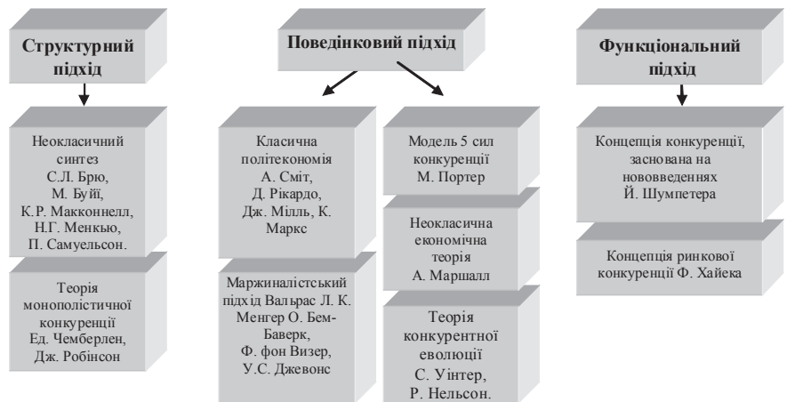
Рис. 2. Класифікація підходів до вивчення конкуренції

2) для досягнення успіху фірма повинна сконцентрувати зусилля на реалізації однієї з трьох типових стратегій. "Компанія, яка дотримується то однієї базової