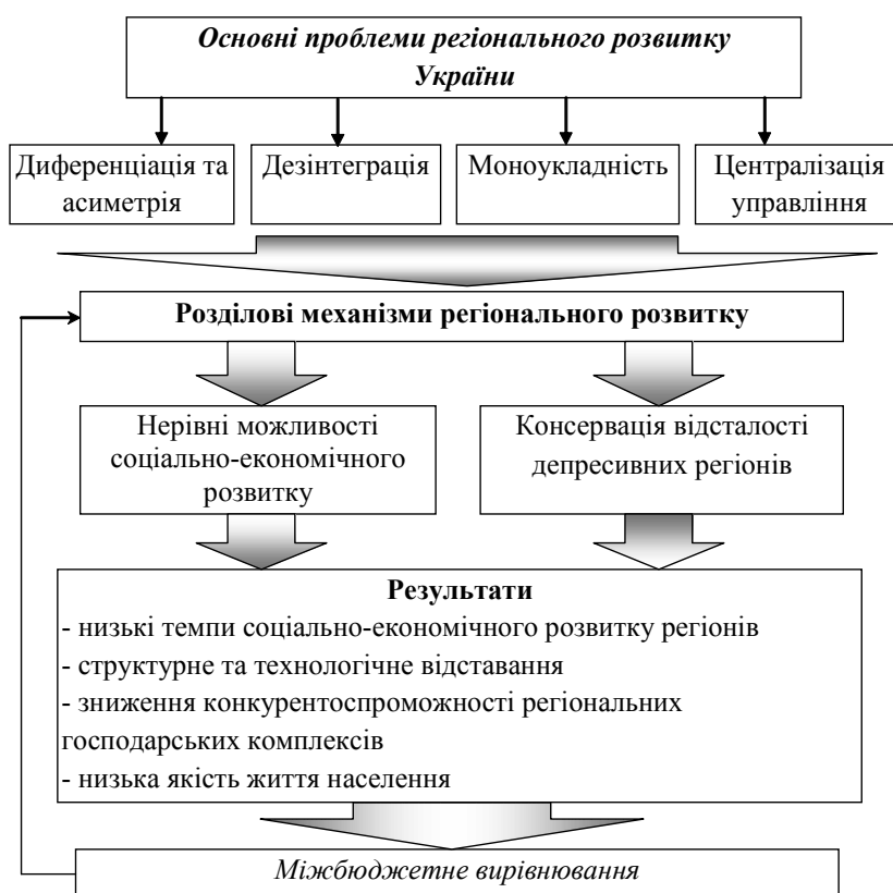
Рис. 1. Основні проблеми регіонального розвитку України

— підвищення стійкості до циклічних коливань світової кон'юнктури;