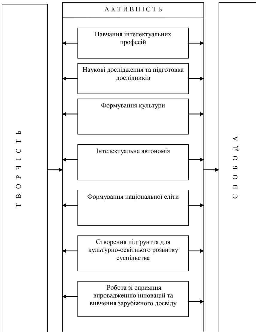
Рис. 2. Схема реалізації принципу єдності творчості, активності, свободи

пошук і паралельне дослідження суспільства. Університети навчають інтелектуальних професій і готують майбутніх дослідників, плекають науку, вчать пізнавати. Ці завдання є визначальними для діяльності університетів протягом всієї історії їхнього існування.