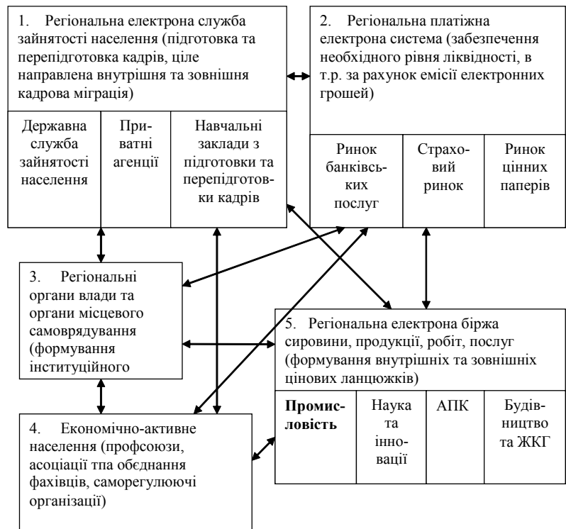
Рис. 2. Модель системи антикризових механізмів промислового сектора економіки регіону

Ініціація реалізації моделі нормативно зумовлена, наприклад, у Концепції державної регіональної політики визначено, що "головною метою органів державної влади при формуванні і реалізації регіональної політики є створення умов для динамічного, збалансованого соціально-економічного розвитку України та її регіонів, підвищення рівня життя населення, забезпечення додержання гарантованих державою соціальних стандартів для кожного її громадянина незалежно від місця проживання, а також поглиблення процесів ринкової трансформації на основі підвищення ефективності використання потенціалу регіонів, підвищення дієвості управлінських рішень, удосконалення роботи органів державної влади та органів місцевого самоврядування, що здійснюють взаємодію з населенням з метою стійкого розвитку, благополуччя і процвітання його населення, збереження сприятливого навколишнього середовища".