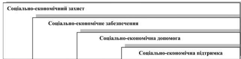
Рис. 2. Співвідношення між соціальним захистом, соціальним забезпеченням, соціальною допомогою та соціальною підтримкою

Перед тим як дати комплексне повне визначення категорії соціально-економічного захисту пропонуємо детально вивчити думку деяких вітчизняних та зарубіжних науковців стосовно існуючого поняття "соціальний захист населення".