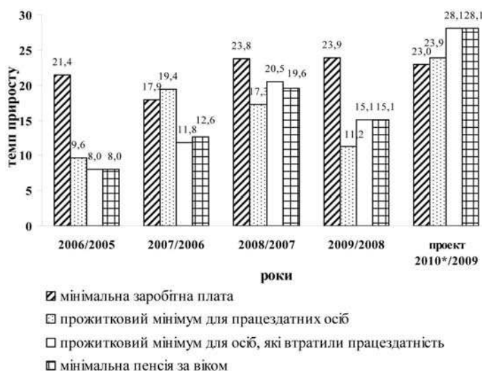
Рис. 3. Темпи приросту основних соціальних стандартів за 2005—2010 роки

— дроблення середніх підприємств з метою використання спрощеної системи;