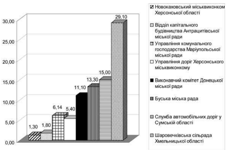
Рис. 2. Приклади виявлених зайвих витрат у сфері державних закупівель шляхом оперативного контролю

Перевірку в Службі автомобільних доріг у Сумській області під час аналізу виконання переможцем торгів ЗАТ "С" договору із закупівлі поточного ремонту мостів на автомобільних дорогах місцевого значення вартістю 2,3 млн грн. встановлено, що до актів приймання виконаних підрядних робіт окремі види матеріалів останній включав за ціною вищою, ніж передбачено тендерною пропозицією. Загальна сума зави-