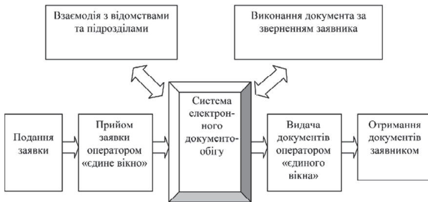
Рис. 1. Систематизація якісних ознак принципу дії "єдиного вікна"

всі державні органи, втягнуті в процес документообігу з підприємствами, будуватимуть свої системи за другим сценарієм. При цьому зовсім не обов'язково уніфікувати всі формати й не треба організувати документообіг між кожним оператором і кожним підрозділом державного органу. Усі ці питання створення єдиного вікна можна буде вирішити за умов інтеграції систем, що розширюються, електронного документообігу шляхом організації обміну даними між серверами операторів [4].