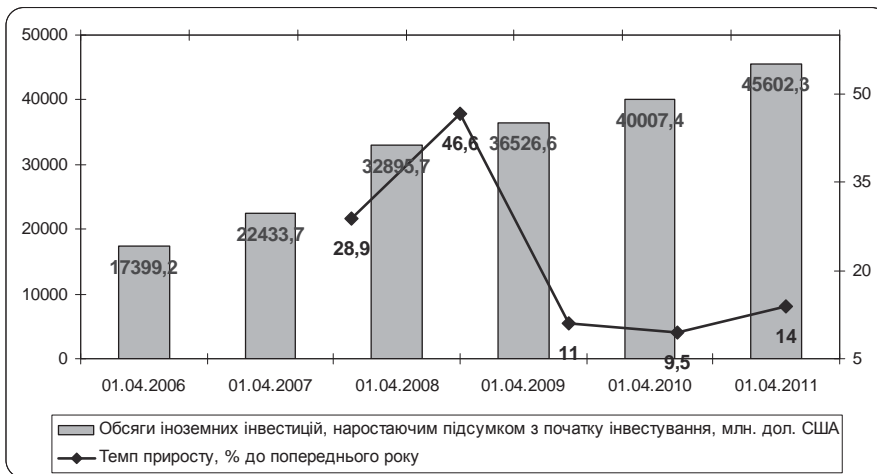
Рис. 1. Динаміка іноземних інвестицій в Україну*

* Складено авторами самостійно за джерелом [9].