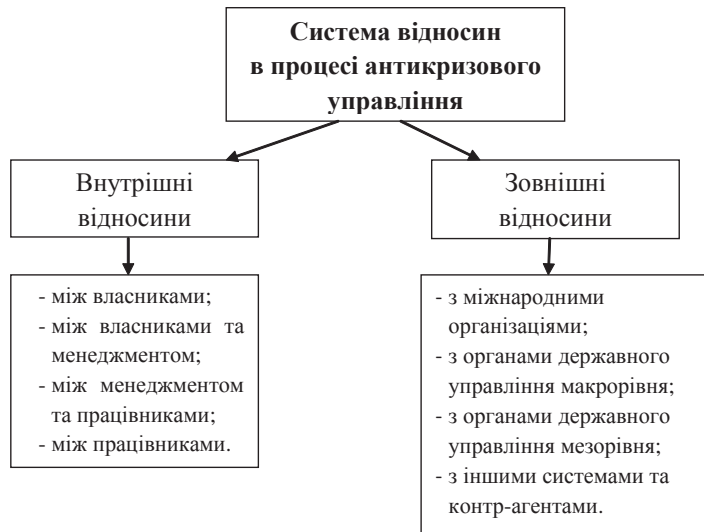
Рис. 2. Система відносин у процесі антикризового управління

плексний, системний характер, вирішувати не тільки стратегічні, довгострокові, а й тактичні, оперативні завдання;