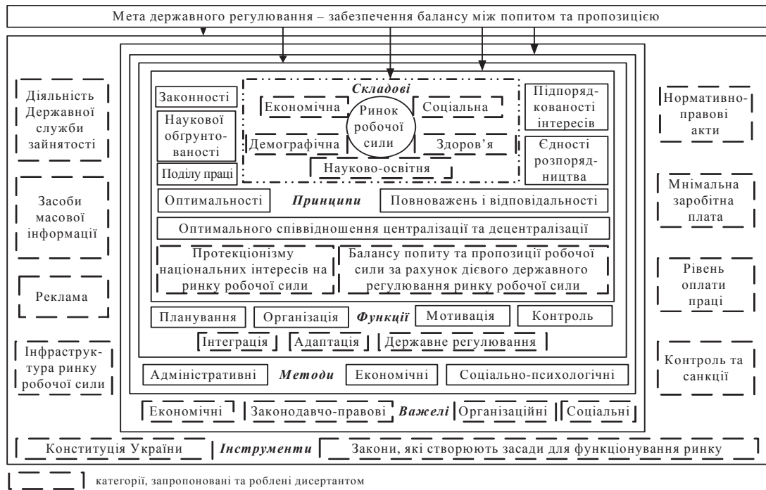
Рис. 2. Організаційно-економічний механізм державного регулювання ринку робочої сили

7) впровадженні антикризової політики уряду. Так, у період криз держава намагається збільшити обсяг інвестицій, що зумовлює зростання кількості працюючих;