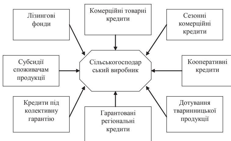
Рис. 2. Система фінансування та кредитування агропродовольчого сектора

Позитивні зрушення стали можливими завдяки цілеспрямованій державній допомозі селу, створенню макроекономічних передумов для реформування агропродовольчої сфери. А конкретніше — списано мільярдні борги, запроваджено помірний і спрощений фіксований сільськогосподарський податок, ефективну бюджетну підтримку кредитування та фінансового лізингу, значні пільги у справлянні податків та інших платежів. Загалом обсяг таких макроекономічних преференцій оцінюється приблизно в 10 мільярдів грн.