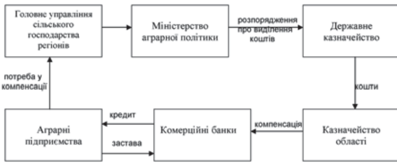
Рис. 1. Схема здешевлення кредитів для аграрних підприємств [1]

рарних підприємств у середньострокових кредитних ресурсах шляхом запровадження державної програми фінансової підтримки підприємств агропромислового комплексу через механізм здешевлення коротко та середньострокових (до 3 років) кредитів [4, с. 49].