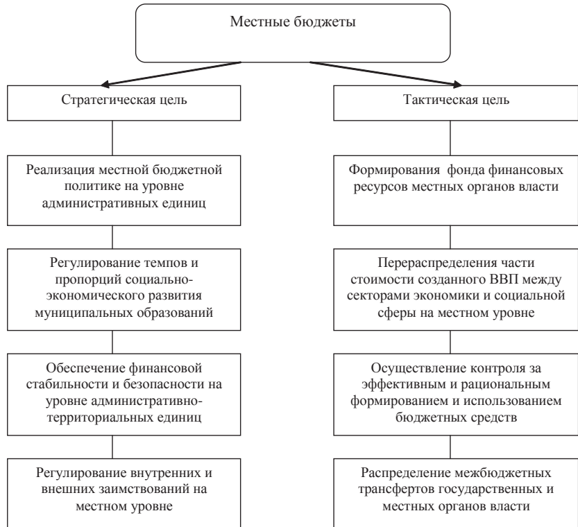
Рис. 2. Стратегические и тактические задачи местных бюджетов в условиях трансформации экономики Украины (Составлено автором)

4. Регулирование внешних и внутренних заимствований на местном уровне. Благодаря местным бюджетам органы местного самоуправления осуществляют контроль над эффективным формированием и погашением внутренних и внешних заимствований.