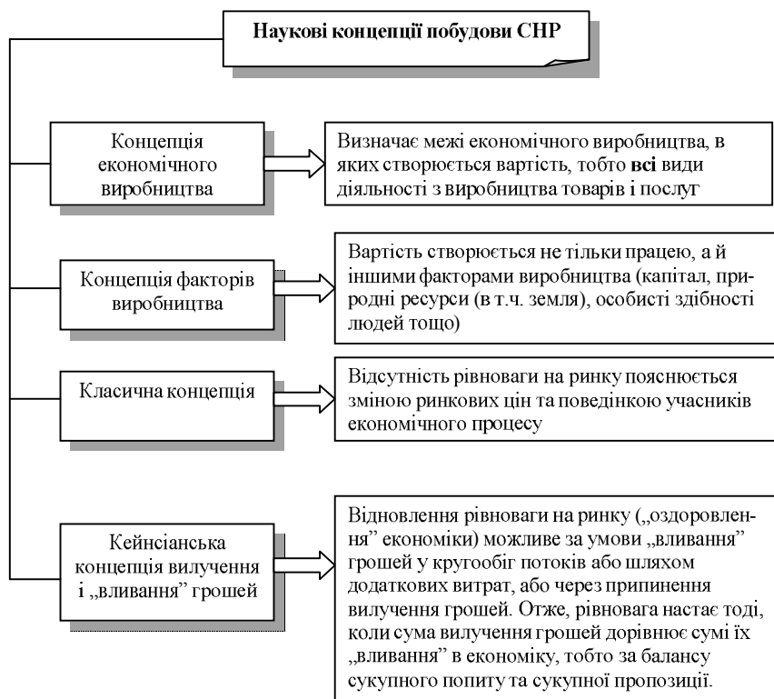
Рис. 1. Наукові концепції побудови СНР