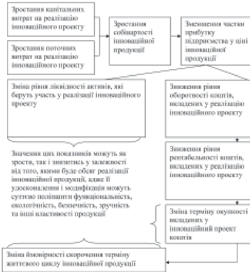
Рис. 1. Взаємозв'язки між показниками бізнес-плану інноваційного проекту, коригування, яких відбуватиметься у зв'язку із реалізацією заходів, спрямованих на удосконалення і модифікацію інноваційної продукції