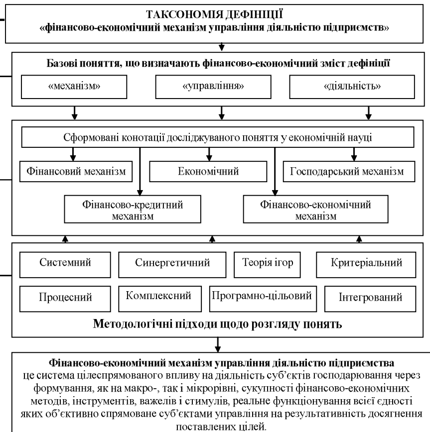
Рис. 2. Підходи щодо визначення суті дефініції "фінансово-економічний механізм управління діяльністю підприємства".