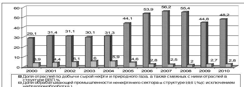
Рис. 3. Удельный вес добывающей и обрабатывающей промышленности в структуре ВВП

В 2009—2010 г.г., на которые приходился пик мирового экономического кризиса, наблюдалось снижение темпа прироста. Так, по данным Государственного Комитета Статистики Азербайджанской Республики, рост ВВП в 2009 по