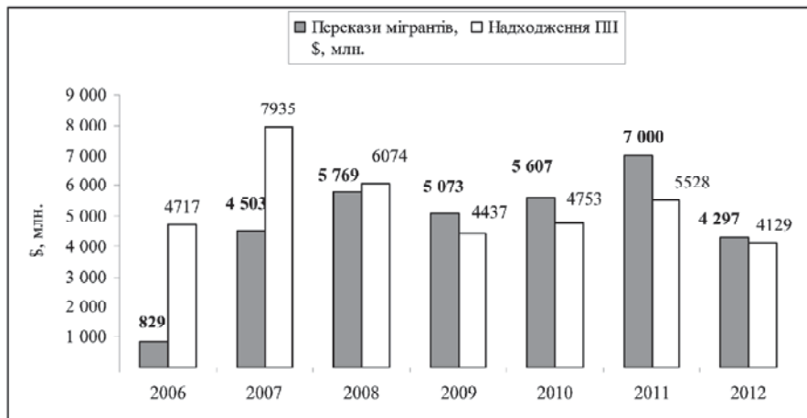
Рис. 2. Перекази мігрантів та надходження ПІІ в Україну в 2006—2012 рр.