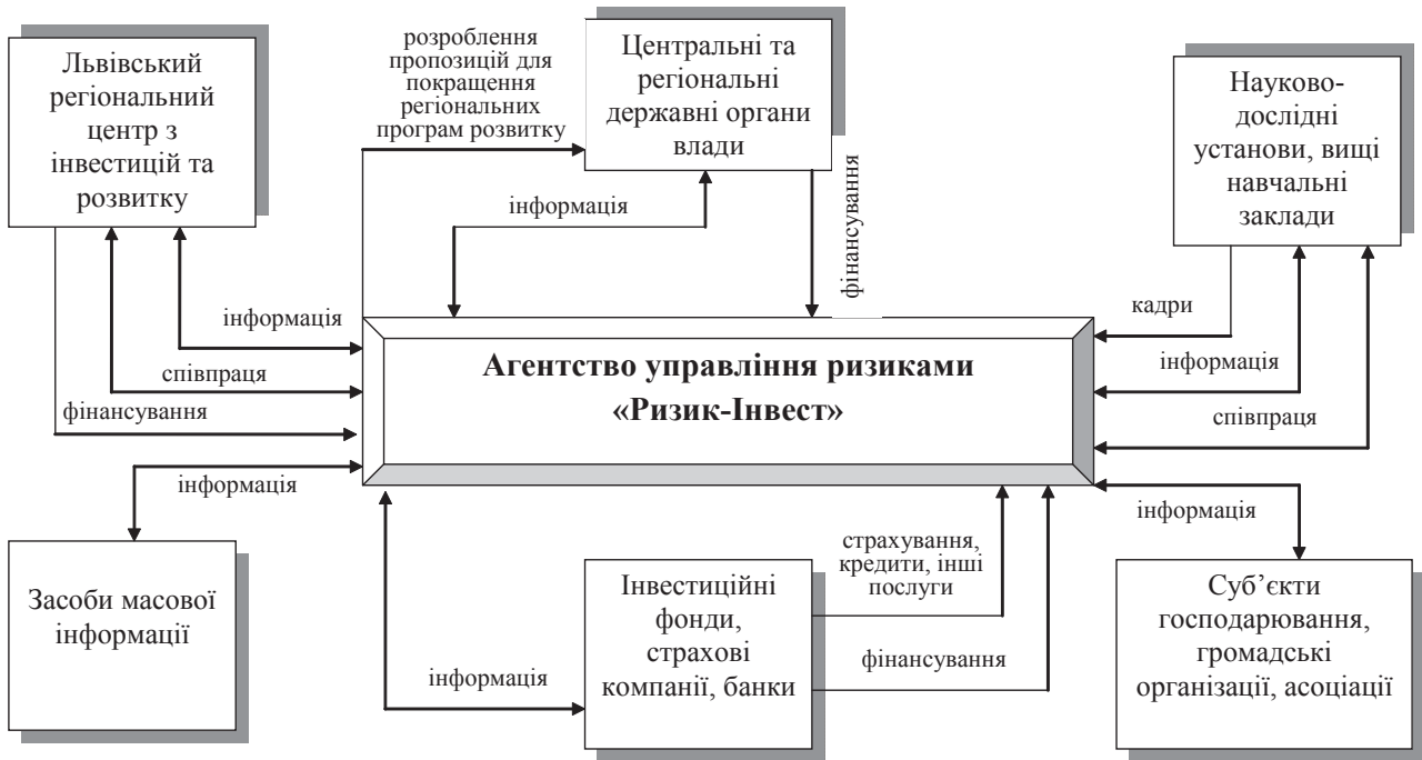
Рис. 2. Напрями взаємодії Агентства управління інвестиційними ризиками "Ризик-Інвест" з іншими учасниками інвестиційного процесу в регіоні