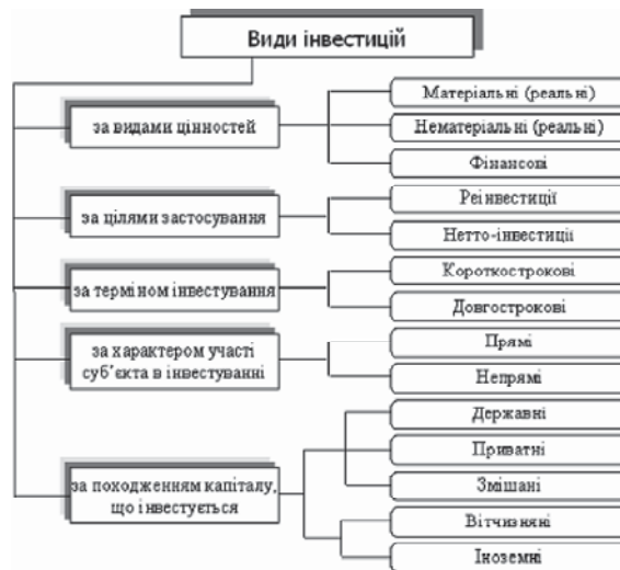
Рис. 1. Класифікації інвестицій за видами діяльності

Інвестиції — відносно новий для нашої економіки термін. У рамках централізованої планової системи використовувалося поняття "валові капітальні вкладення", під якими розумілися всі витрати на відтворення основних фондів, включаючи витрати на їхній ремонт. Інвестиції більш широке поняття. Воно охоплює і так звані реальні інвестиції, близькі за змістом до терміну "капітальні вкладення", і "фінансові" (портфельні) інвестиції, тобто вкладення в акції, облигації, інші цінні папери, пов'язані безпосередньо з титулом власника, що дають