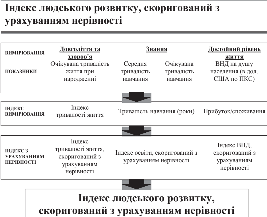
Рис. 3. Індекс людського розвитку, скоригований з урахуванням нерівності

У 2010 році сімейство індикаторів, які вимірюють ІЛР, було розширено, а сам індекс піддався істотному коригуванню. На додаток до використовуваного ІЛР (рис. 1), який є зведеним показником, що спирається на статистичні дані середні по країнах і не враховує внутрішньої нерівності, були введені три нові індикатора: Індекс людського розвитку, скоригований з урахуванням соціально-економічної нерівності (ІЧРН) (рис. 3),