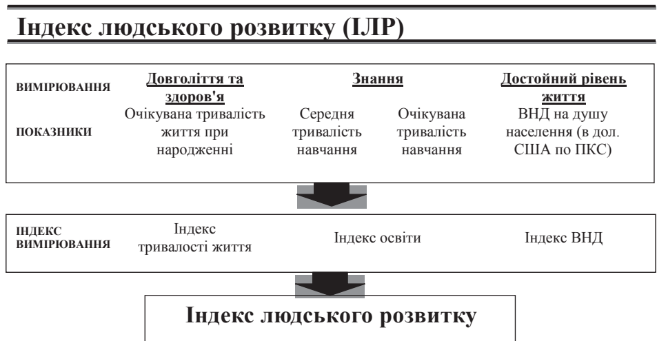
Рис. 1. Розрахунок Індeksu людського розвитку