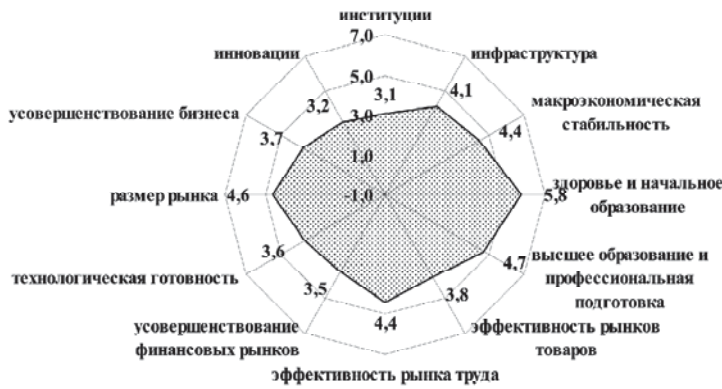
Рис. 2. Складові індексу конкурентоспособності України, 2012–2013 г.