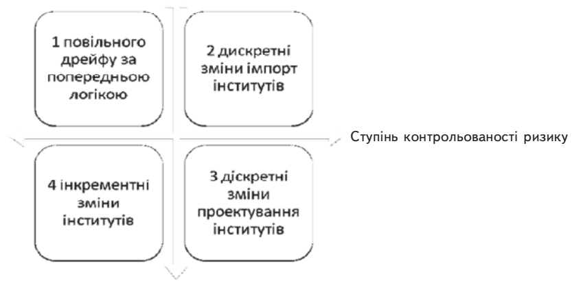
Рис. 3. Матриця компаративного аналізу моделей трансформування інститутів зовнішньоекономічної діяльності