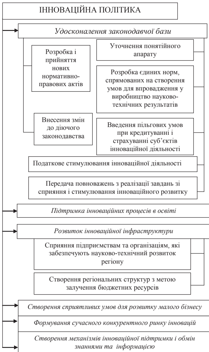
Рис. 1. Пріоритетні напрями реалізації інноваційної політики