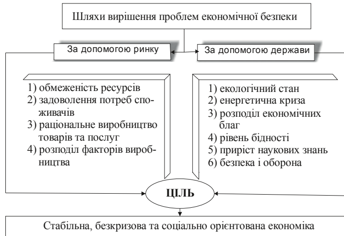
Рис. 3. Шляхи вирішення проблем ринкового та державного регулювання економічної безпеки