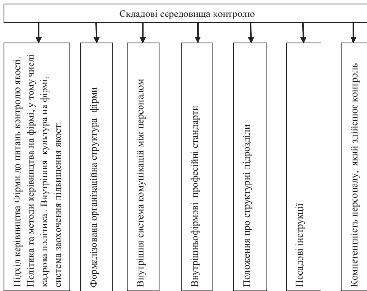
Рис. 1. Складові середовища контролю

Свідцтво АПУ, термін чинності якого становить п'ять років.