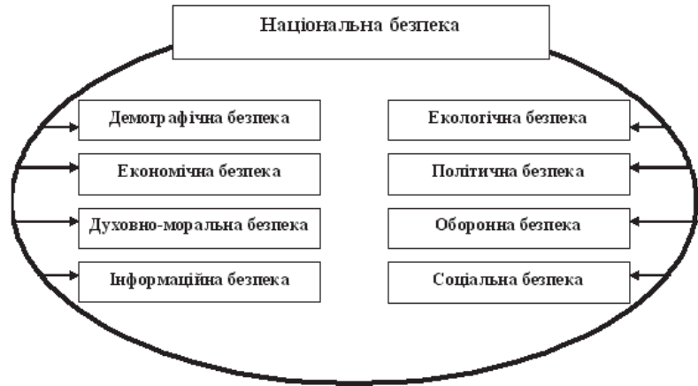
Рис. 1. Структура національної безпеки

При розгляді політичного фактора мається на увазі вплив політичних рішень на економічні показники й, опосередковано, на ступінь вразливості економіки. Вплив військових факторів багатозначний. З одного боку, мілітаризація економіки спричиняє нестійкість усієї системи