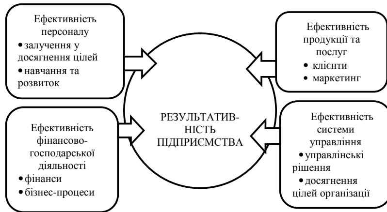
Рис. 2. Результативність підприємства

відповідальність, в цілі підрозділу та конкретних людей, щоб кожному співробітнику було зрозуміло, що він повинен робити, щоб компанія жила та розвивалась успішно.