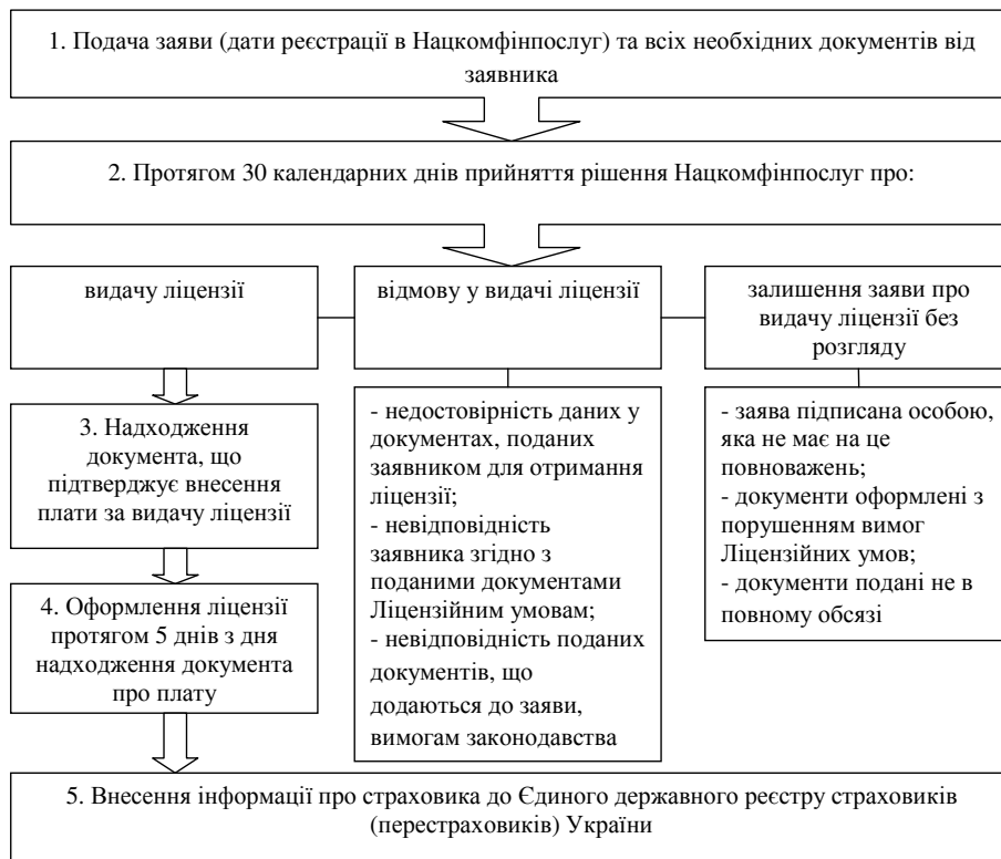
Рис. 2. Порядок подання та розгляду документів для отримання ліцензії