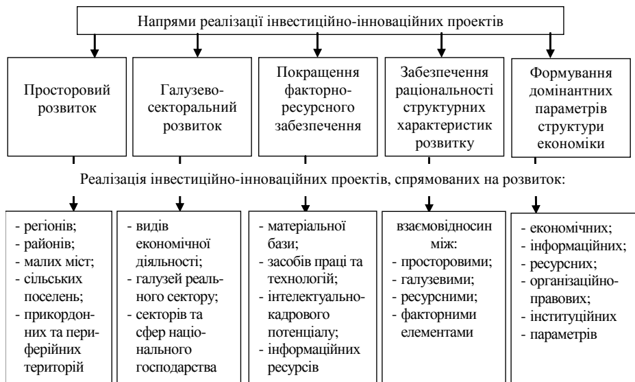
Рис. 2. Пріоритетні сфери реалізації інвестиційно-інноваційних проектів суб'єктів підприємництва України

1. The Verkhovna Rada of Ukraine (2012), The Law of Ukraine "On the development and state support of small