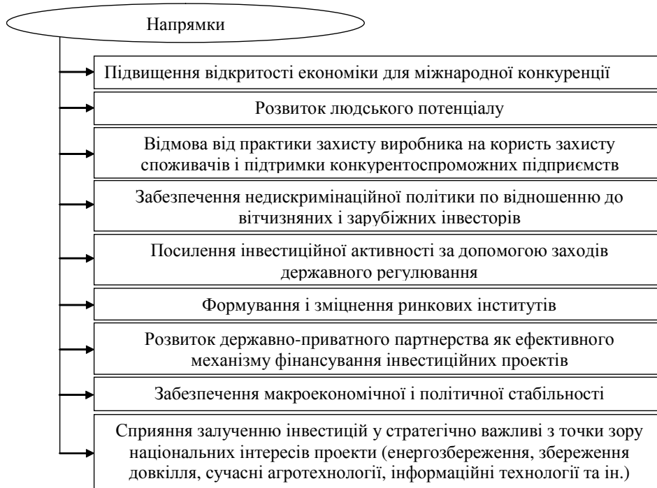
Рис. 4. Основні напрями формування інтегрованої стратегії підвищення інвестиційної привабливості України