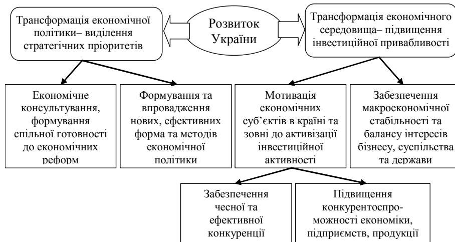
Рис. 1. Система чинників соціально-економічного розвитку України