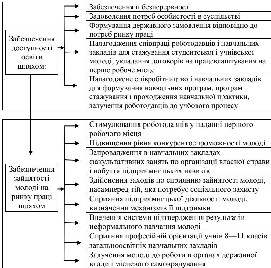
Рис. 1. Заходи реалізації державної молодіжної політики України в сфері зайнятості та підвищення конкурентоспроможності